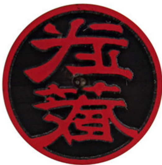
従来 (Ver.2.0/2.5/2.8) の彫刻方式